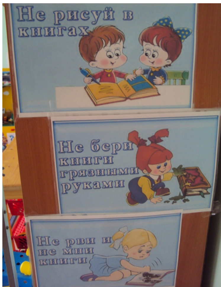
Правила работы с книгой