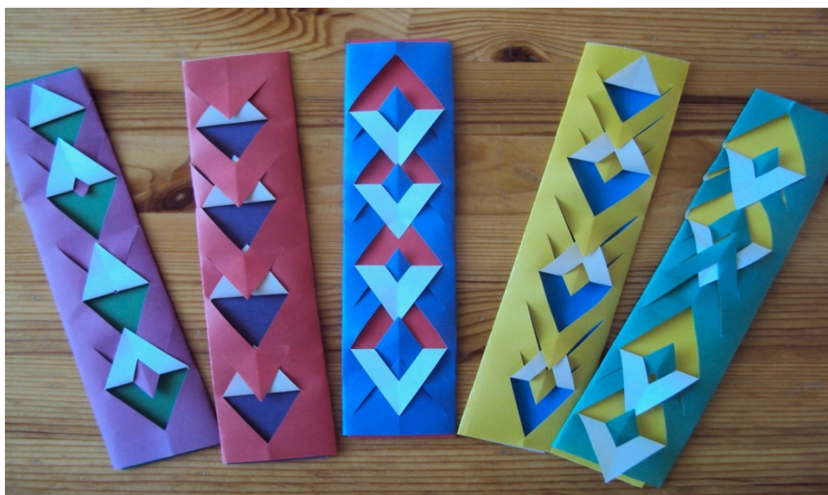
Практическая деятельность (закладки)